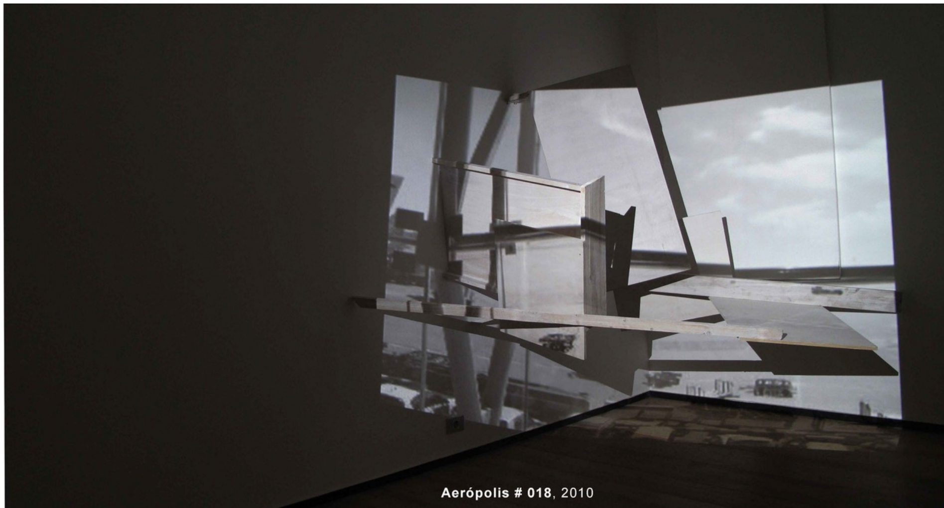
Aerópolis # 018, 2010

Specific Site Work Estructura de madera, pared y videoproyección (aerópolis DVD. 1'8'' min. 89 x 195 x 463 cm