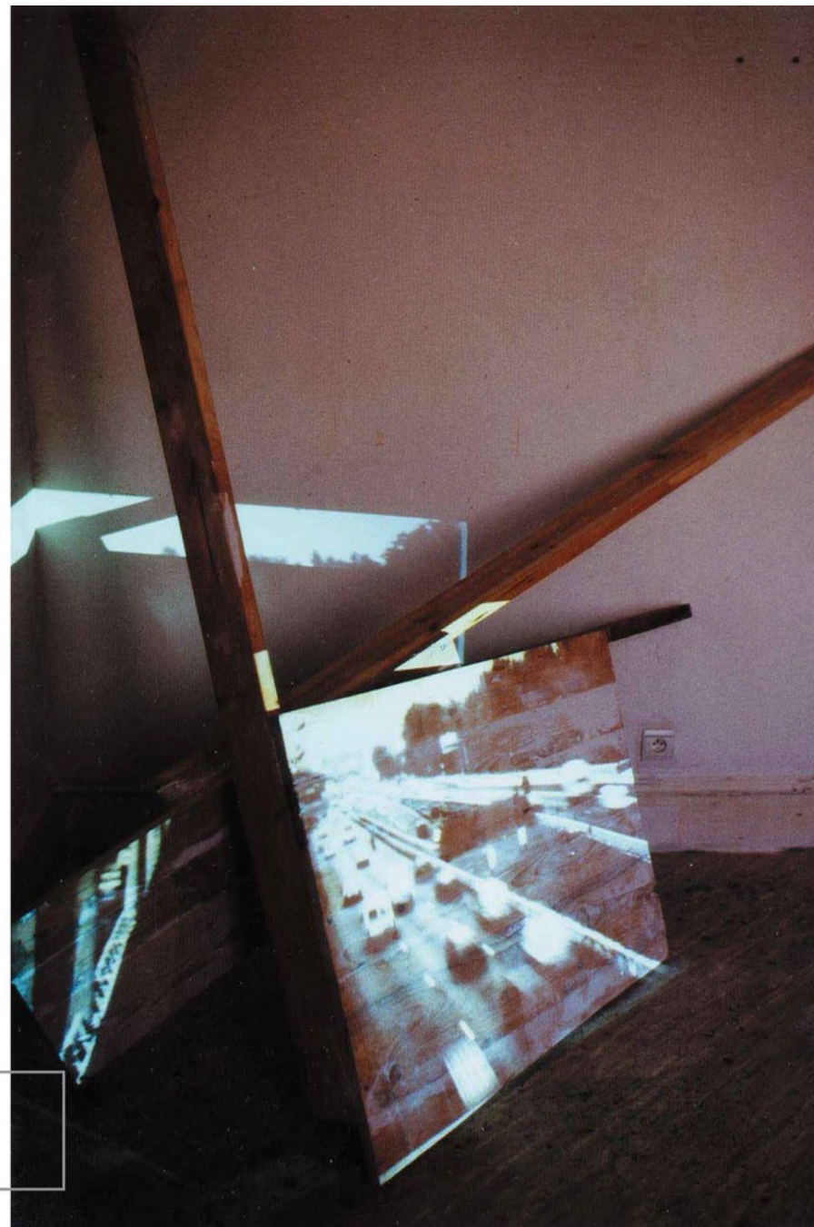
LeJardin #8, 1997 Madera y proyección de diapositivas. 200 x 180 x 90 cm Colección Museo de Arte Moderno de Tarragona