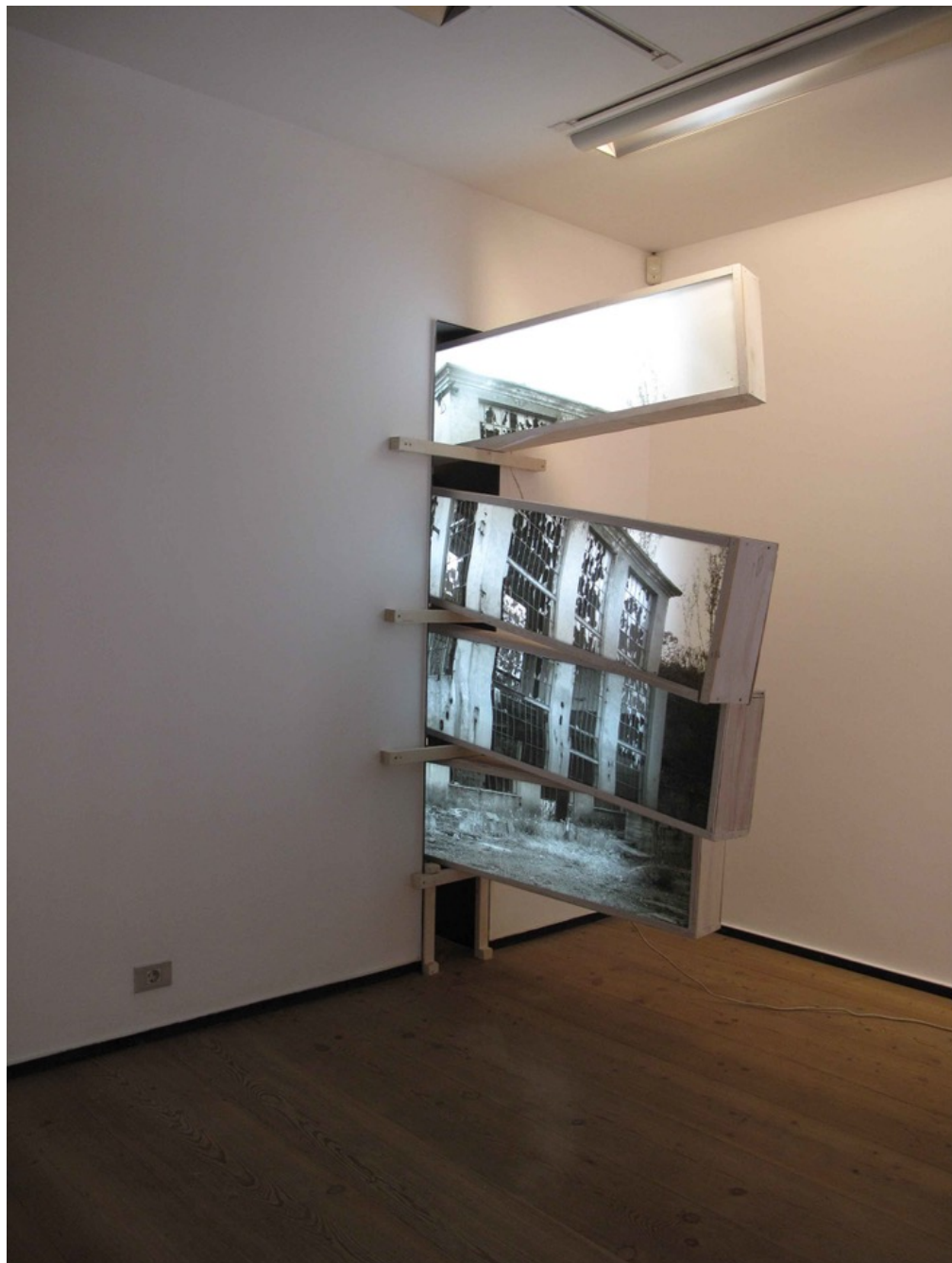
"DISurbia, la piel olvidada #01" . 2014 Impresión BackLite sobre caja de luz (4 cajas) 240 x 242 x 75 cm.