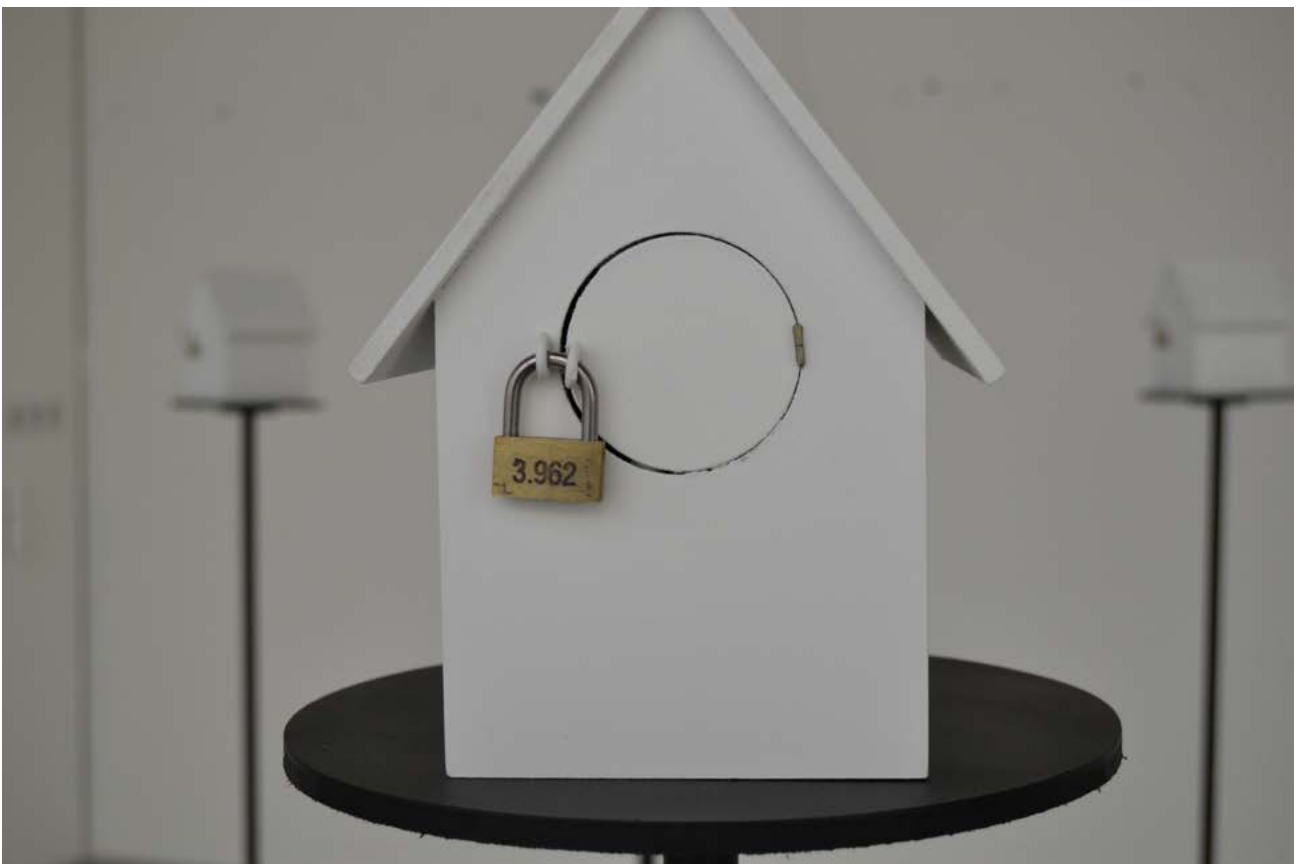
Algo falla. 2016 600x600x135 Casas de pájaro y candados.