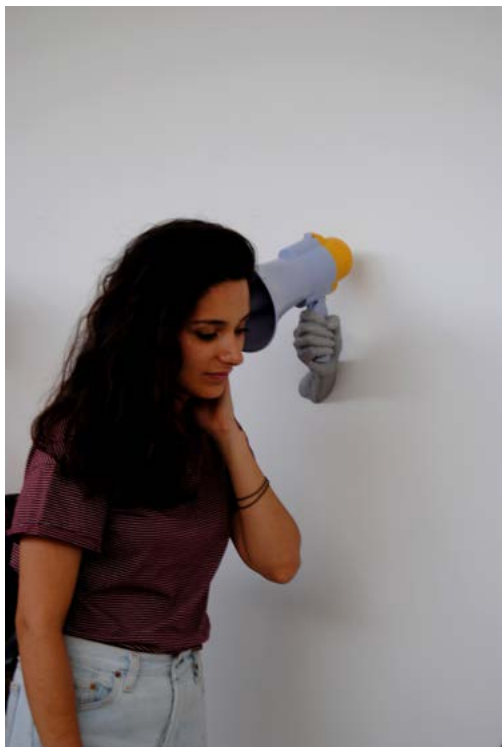
Mayoría silenciada. 2016 1000x135x30 Resina de poliéster y megáfonos.