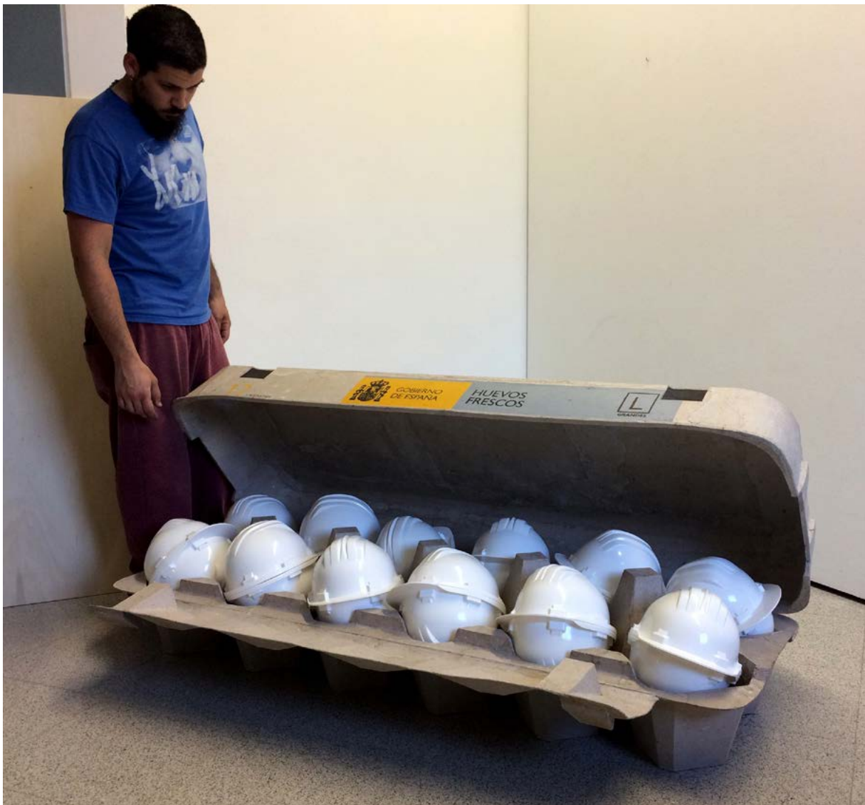
Huevos de gallinas criadas en jaulas. 2017 170x80x60 Cartón y cascos de obra.