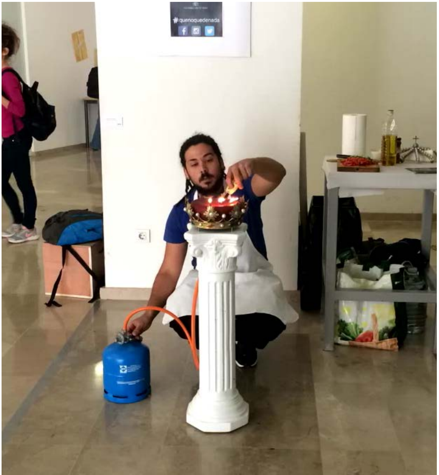
Hasta que no quede nada. 2016 3'42" Video-performance.