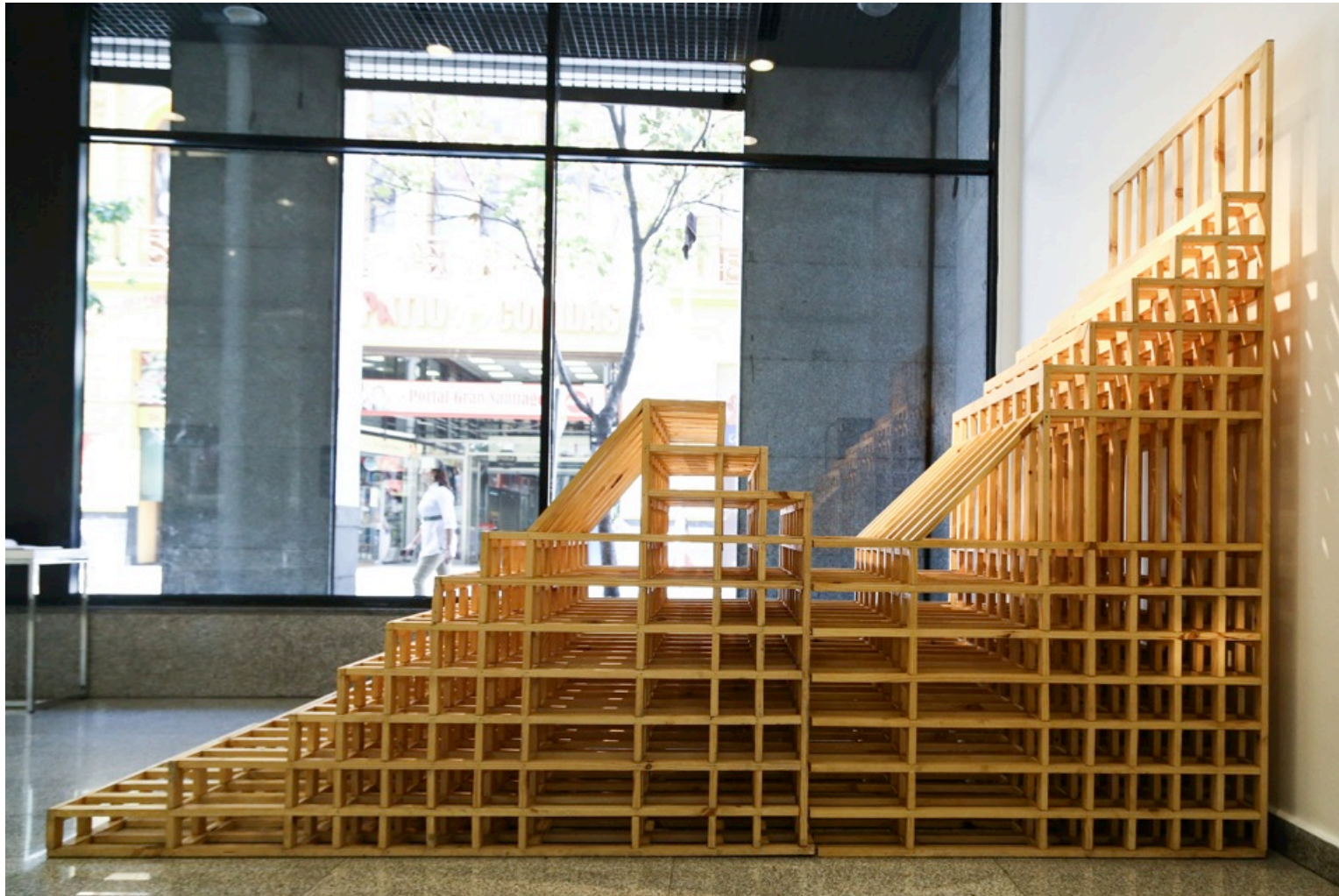
Estudio de perfil topográfico chileno. Escultura de madera. Interpretación del relieve geográfico desde la Cordillera de los Andes, Depresión Intermedia, Cordillera de la Costa y Planicies Litorales. 3 metros de largo x 2,2 metros de alto x 122 cm de ancho aprox.