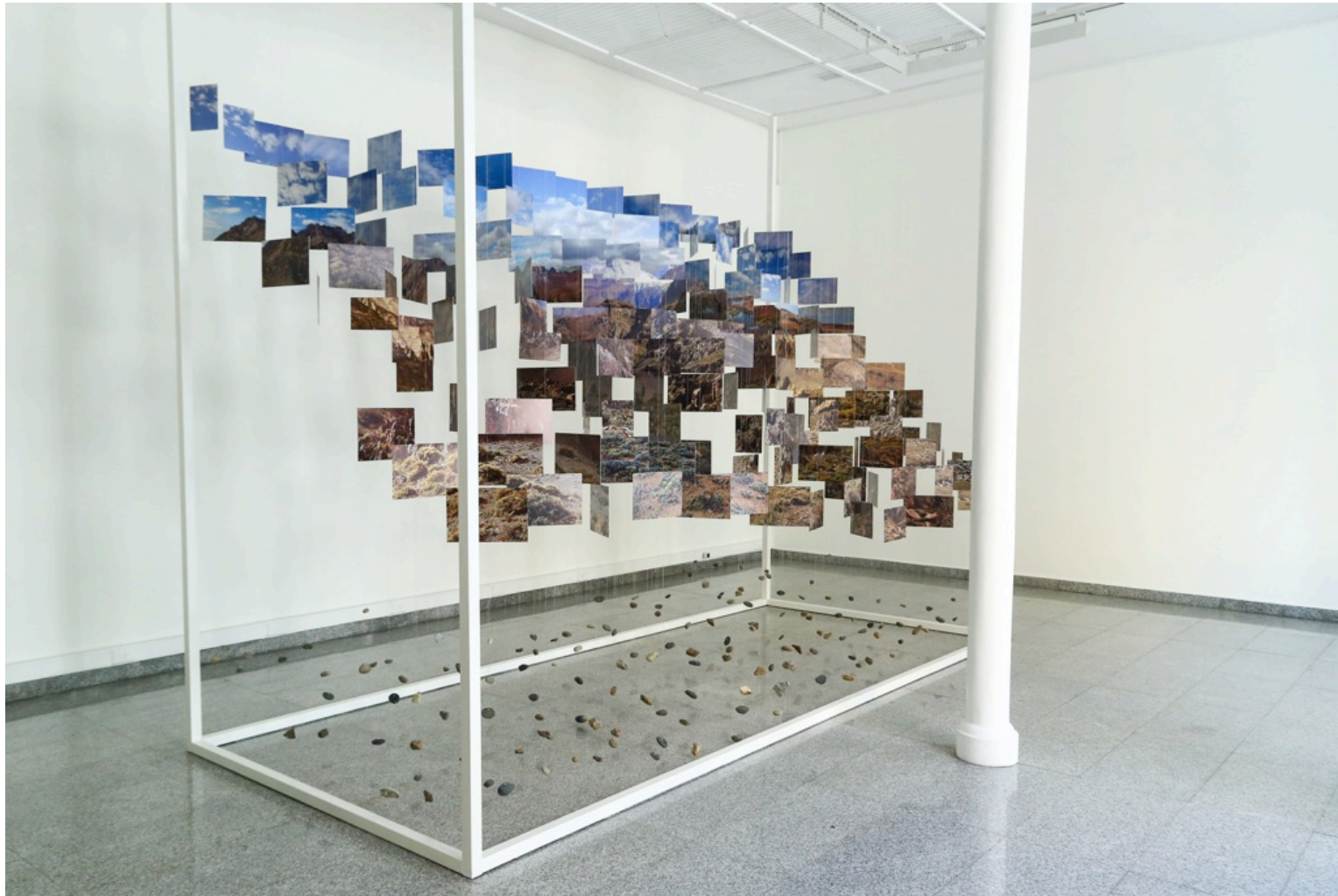
Paisaje Flotante. Móvil de 150 impresiones fotográficas en pai. 150 piedras recolectadas de los paisajes fotografiados. 5 metros de largo x 4 metros de alto x 2 metros de ancho.