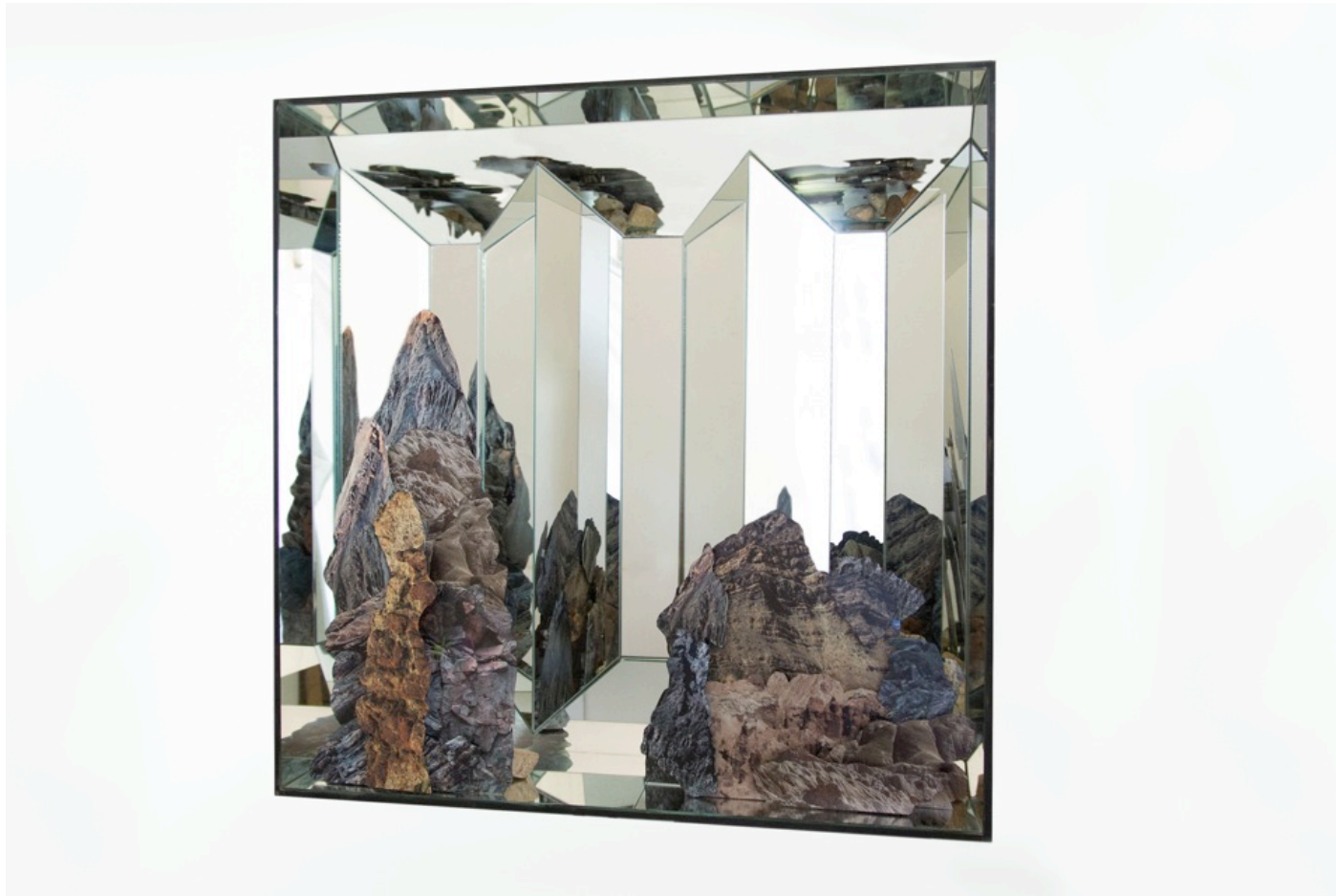
Paisaje Objetual II . Caja de espejos de 1 metro de largo x 1 metro de alto x 30 cm de ancho aprox. Impresiones fotográficas en pai. Piedras recolectadas de los paisajes fotografiados.

Exposición Paisaje Objetual , Sala Gasco Arte Contemporáneo. Santiago de Chile, 2016.